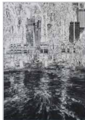
優秀賞(青森朝日放送賞) 松井 亜希子[滋賀県] 《The heat haze is shimmering》 版画・銅版画